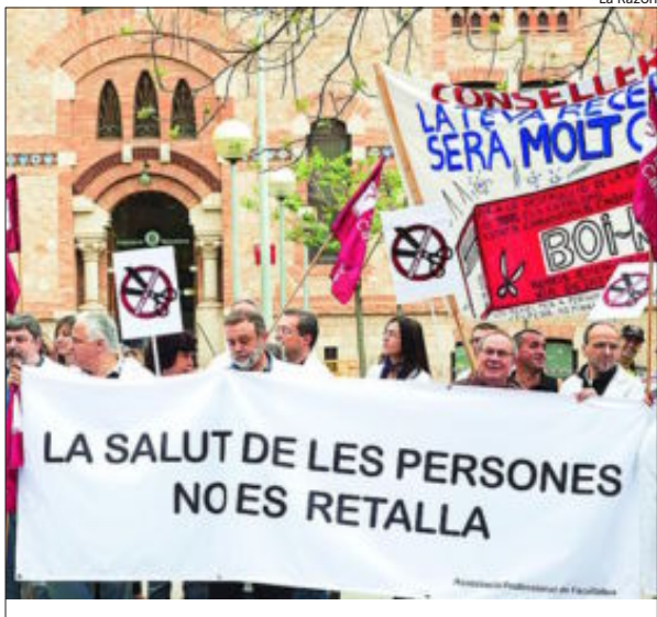
El sector sanitario denuncia que Salud sólo ha pagado el 66 por ciento de la factura correspondiente a septiembre