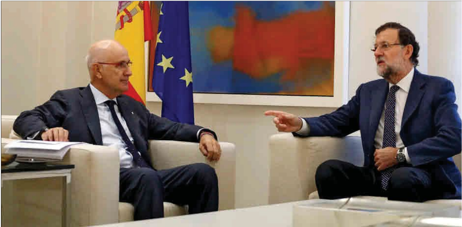
Mariano Rajoy y Josep Antoni Duran Lleida, ayer en Moncloa, durante la reunión que mantuvieron dentro de la ronda de contactos que el presidente ha celebrado con líderes políticos.