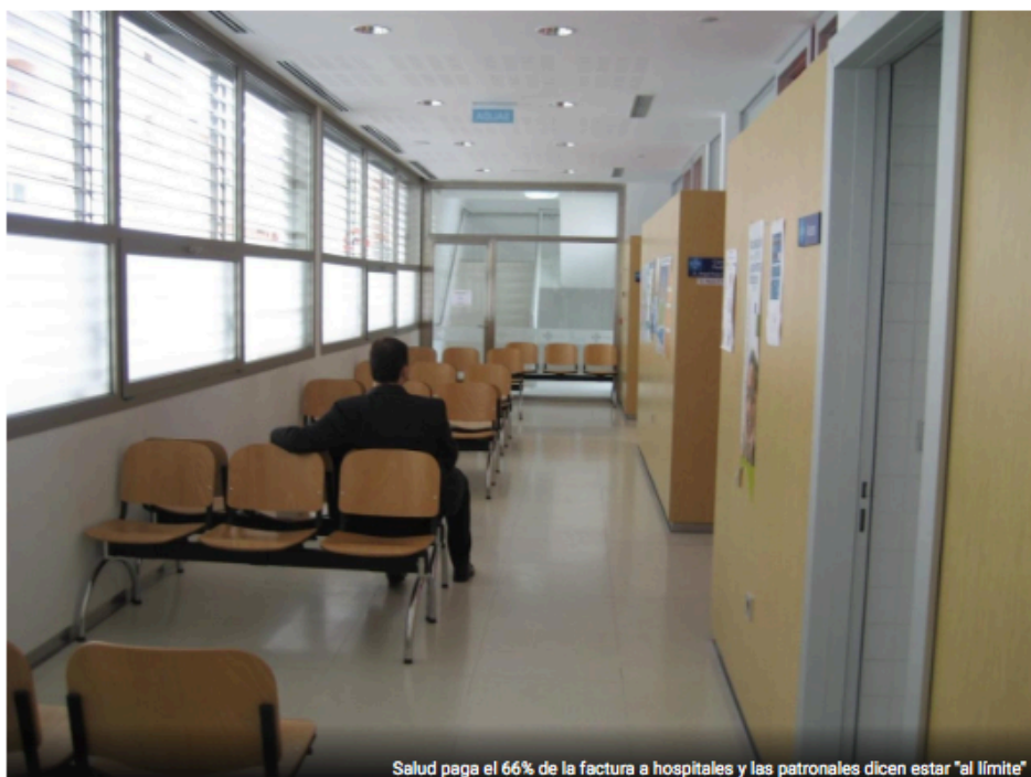
Salud paga el 66% de la factura a hospitales y las patronales dicen estar "al límite"