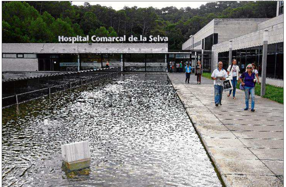
Entre els hospitals que formen part de les patronals que fan la denúncia hi ha el de Palamós, Blanes, Campdevàrol o Santa Caterina.

«A aquesta situació d'asfíxia econòmica cal afegir que encara